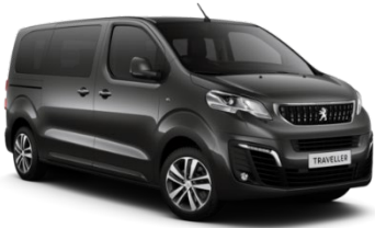
M0VL | Platinumin harmaa