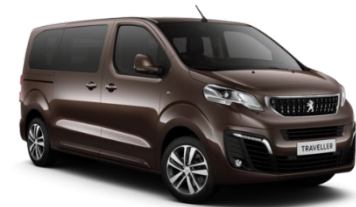
M0G6 | Tammen ruskea