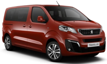
M0V7 | Turmaliinin punainen