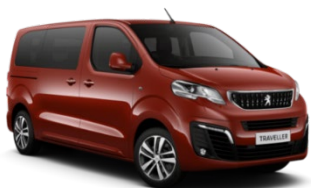
M0V7 | Tourmaline Orange