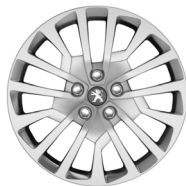
17" teräsvanne 'Miami'