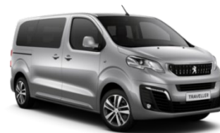
M0F4 | Artense Grey