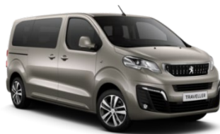
M0EU | Nautille Beige