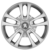
16" teräsvanne 'San Fransisco'