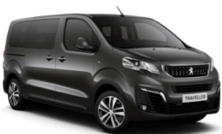
M0VL | Platinum Grey