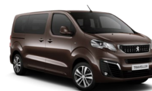
M0G6 | Rich Oak Brown