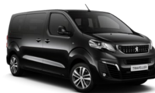
M09V | Perla Nera Black