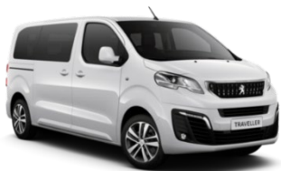
P0WP | Ice Pack White