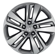
17" kevytmetallivanne 'Phoenix'