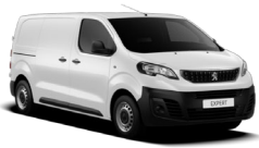
P0WP | Ahtojään valkoinen (perusväri)