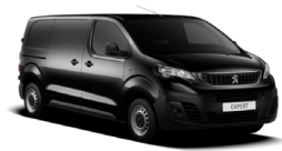
M09V | Perla Nera musta (metalliväri)