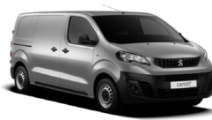
M0F4 | Artensen harmaa (metalliväri)