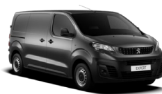
M0VL | Platinumin harmaa (metalliväri)