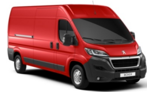
P01X | Tizianon punainen (pastelliväri)