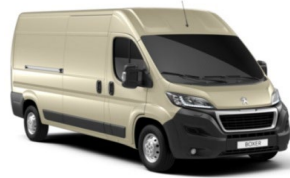
M0H8 | Kullan valkoinen (metalliväri)