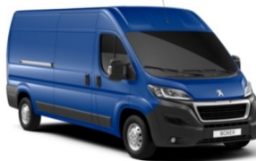
P05V | Linen sininen (pastelliväri)