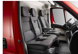
35FX | Darko kangasverhoilu