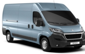
M04F | Lago Azzuro sininen (metalliväri)