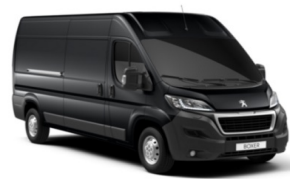
M0E9 | Grafiitin harmaa (metalliväri)