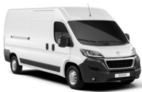
P0WP | Ahtojään valkoinen (pastelliväri)