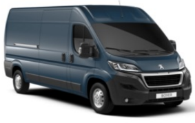
M0ZW | Raudan harmaa (metalliväri)