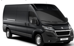
M0E9 | Grafiitin harmaa (metalliväri)