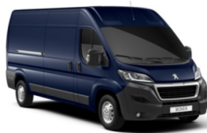
P04P | Imperialin sininen (pastelliväri)