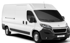
P0WP | Ahtojään valkoinen (pastelliväri)