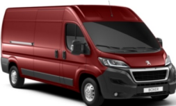
M01Q | Syvänpunainen (metalliväri)