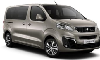
MOEU | Hiekan beige