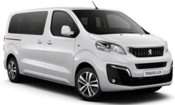
POWP | Ahtojään valkoinen