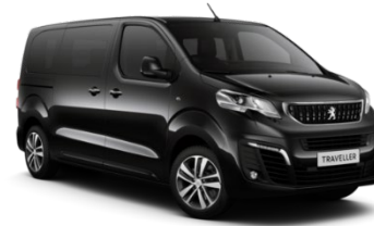
MO9V | Perla Neran musta