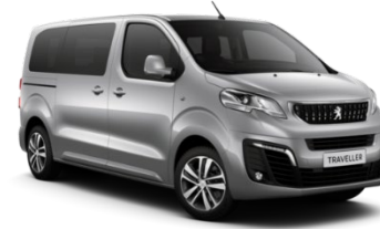
MOF4 | Artensen harmaa