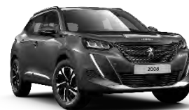
M0VL | Platinum Grey