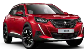
M5VH | Elixir Red