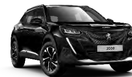
P0XY | Onyx Black / M09V Perla Nera Black