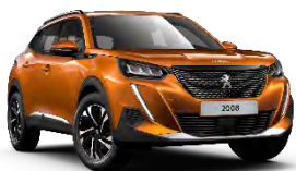
M02S | Orange Fusion