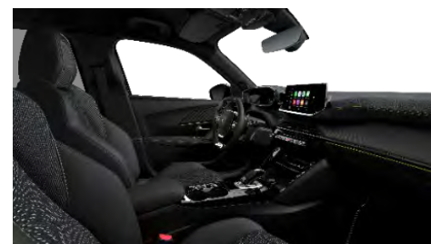
A7FX | GT