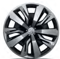
Koristekapseli 16" NOLITA