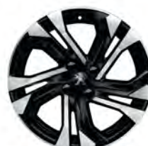
Kevytmetallivanne 17" SALAMANCA

● = vakio ○ = lisävaruste - = ei saatavana