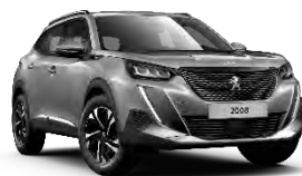
M0F4 | Artense Grey