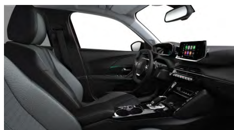
A6FX | Allure Pack