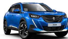
M6SM | Vertigo Blue