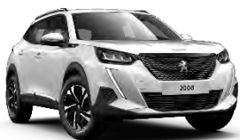
P0WP | Ice Pack White