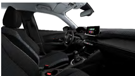
A5FX | Active & Active Pack