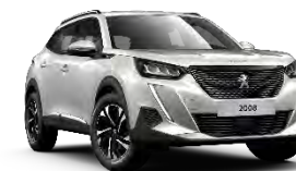
M6N9 | Pearl White