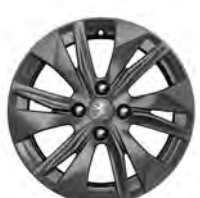
Kevytmetallivanne 16" ELBORN